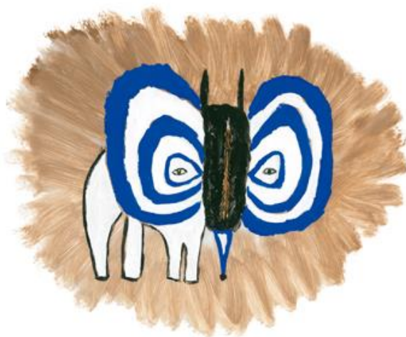
絵本『はいくないきもの』より 絵：皆川明