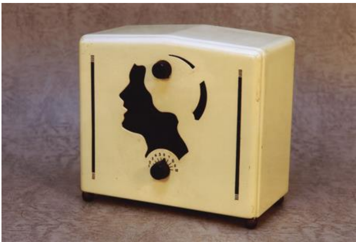
ラジオコレクションより | Stewart Warner (アメリカ)