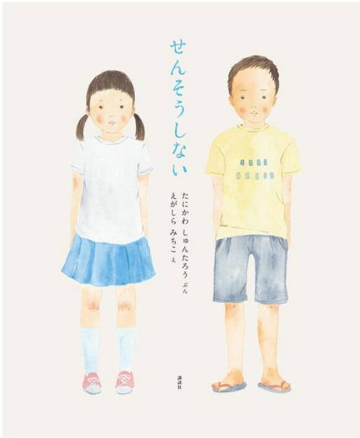
絵本『せんそうしない』より 絵：江頭路子