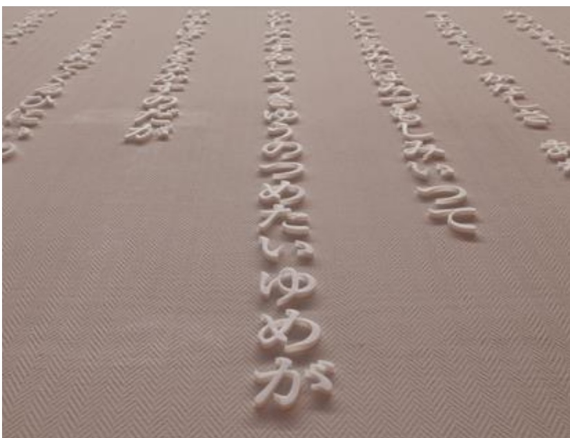
大岡信ことば館ならではの手法による、詩の造形展示イメージ。