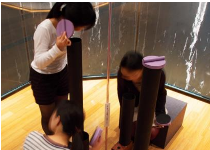
谷川氏本人による詩の朗読を聴くことができる装置（※写真はイメージです）