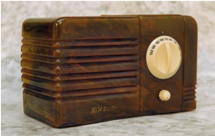
ラジオコレクションより | RCA Victor (アメリカ)