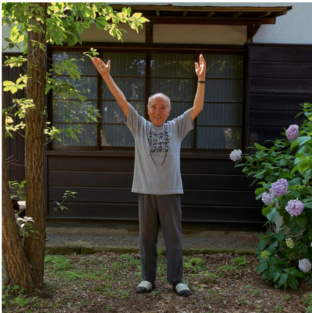
「木になった詩人」