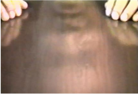
映像作品「ビデオサンプラー」より「インタビュー 机にきく」