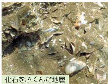
化石をふくんだ地層

地層ができるときに、(13)などがそのまま地層の中に残ることがあります。これらが長い年月をかけて石のようになったものを化石といいます。